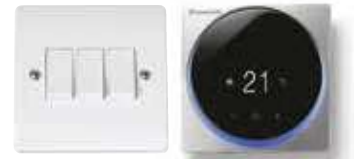
Aydınlatma anahtarı ile aynı boyuttadır. Duvarınızda boyutsal bütünlük sağlar.

Şık tasarımlı kullanıcı dostu kablolu kumanda