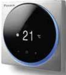
Gümüş rengi RAL 9006 (metalik) BRC1H519S7