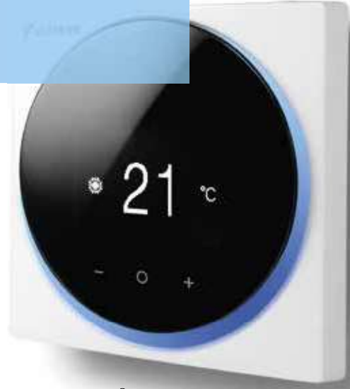
Beyaz RAL9003 (mat) BRC1H519W7

Şık tasarımlı kullanıcı dostu kablolu kumanda