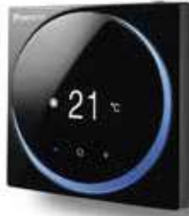
Siyah RAL 9005 (mat) BRC1H519K7